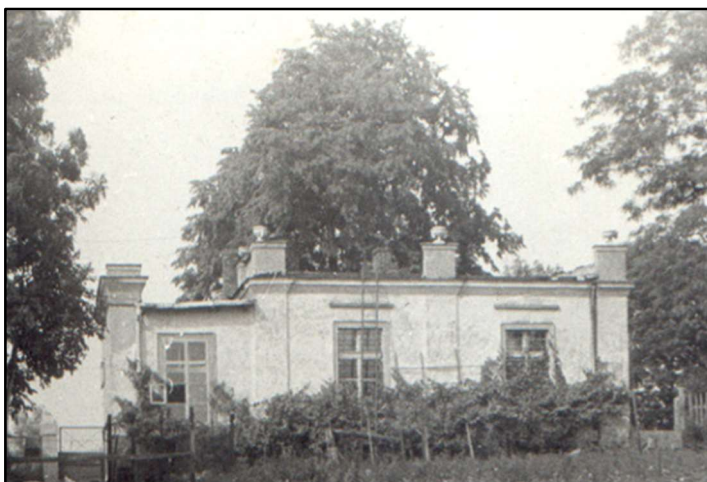
Karczma w Ostrowie

Wiosną 1890 roku pobudowano w Ostrowie szkołę powszechną jednoklasową, do której uczęszczało 35 tutejszych dzieci. Budowa kosztowała 12 500 marek. Wieś liczyła wówczas 144 mieszkańców i 27 domów. Według spisu ludności z 1931 r. zanotowano w Ostrowie 62 domy mieszkalne, 72 mieszkania i 466 osób. Po wojnie Ostrowo było jedną z sześciu gromad gminy Płużnica i obejmowało 1377 ha z 670 mieszkańcami. Kolejne zmiany administracyjne niewiele zmieniły obszar Ostrowa.